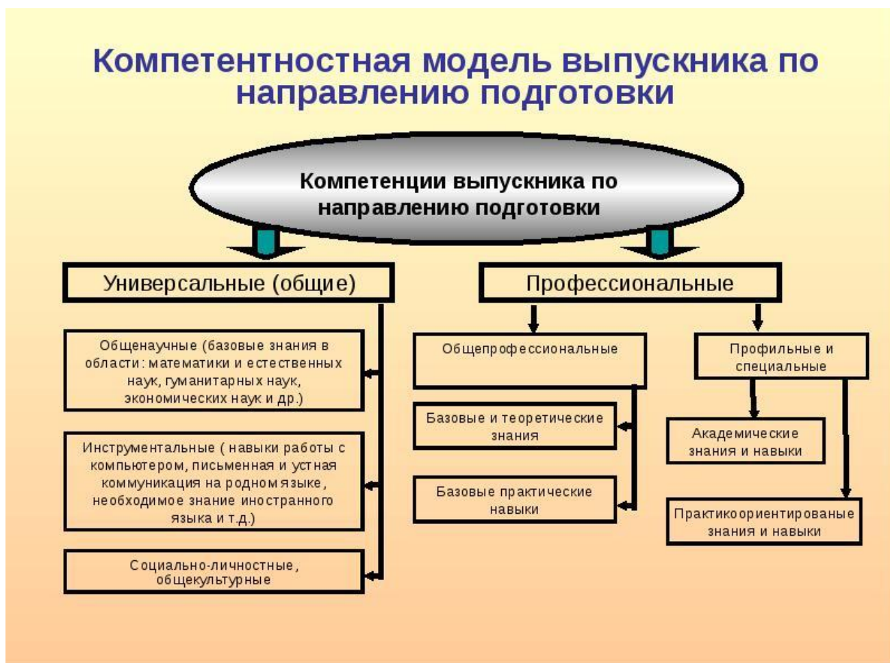
Рисунок 1 – Компетентностная модель выпускника по направлению подготовки

мере возникновения потребностей и приоритетов с учетом компетентностной модели личности выпускника (рис.1) .