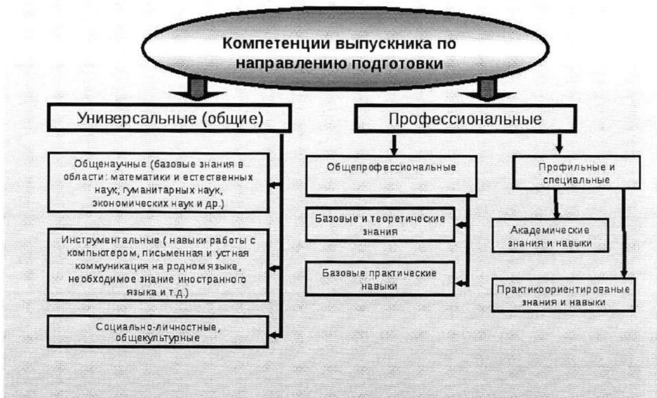
Рисунок 1 – Компетентностная модель выпускника по направлению подготовки